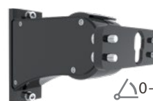
Montura universal para poste ajustable