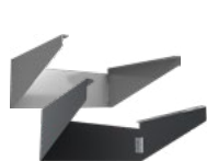
A17-RHS-S-RG A17-RHS-S (hasta 150W)