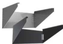
A17-RHS-S-RG A17-RHS-M (200W a 300W)