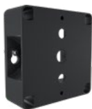
Montura de pared